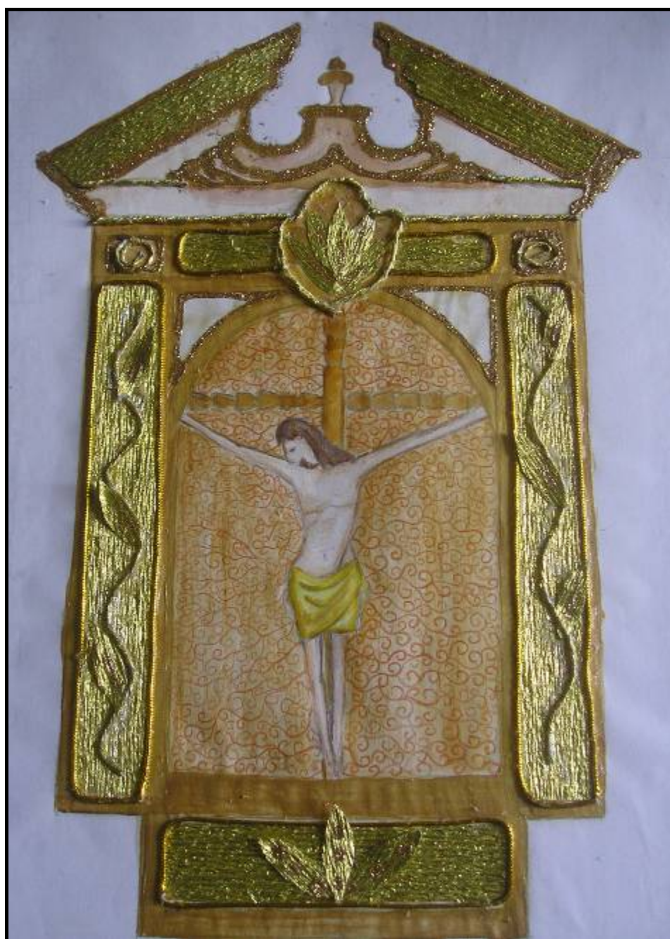
Fig.5 | La nostra interpretazione del crocifisso della Casellina

L'insegna della Compagnia era il Crocifisso ligneo che oggi possiamo ammirare nell'abside della pieve di San Pietro. Questo Crocifisso era oggetto di grande devozione e sino alla fine del '700 si trovava stabilmente collocato presso l'Altare Maggiore dell'Oratorio della Casellina, debitamente ricoperto con la sua mantellina , come si usava fare una volta, quando le immagini sacre venivano scoperte solo in determinate occasioni.