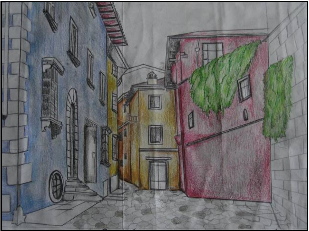
Fig.6 Cancelli, la fonte

Quando nel 1737, il Granducato passò ai Lorena, iniziò un periodo di riforme 'illuminate' che portarono ad una profonda trasformazione della Toscana e così anche a Cancelli rifiorì l'attività artigianale della terraglia.